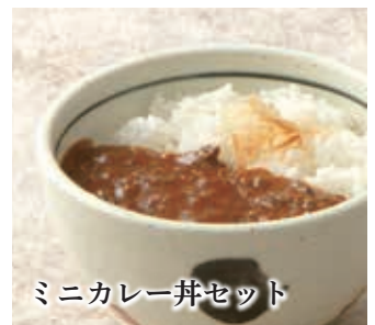
ミニカレー井セット